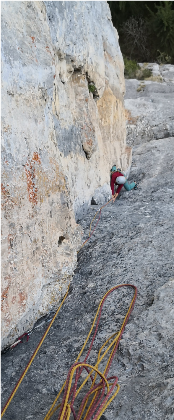
Anregende Kletterei in der steilen Rissverschneidung. SL4