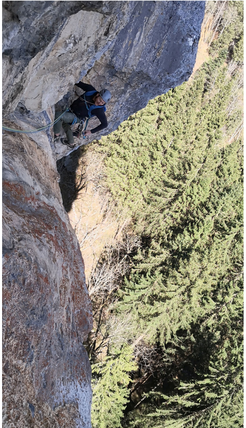
Toller Fels in der zweiten Schuppenlänge. SL3