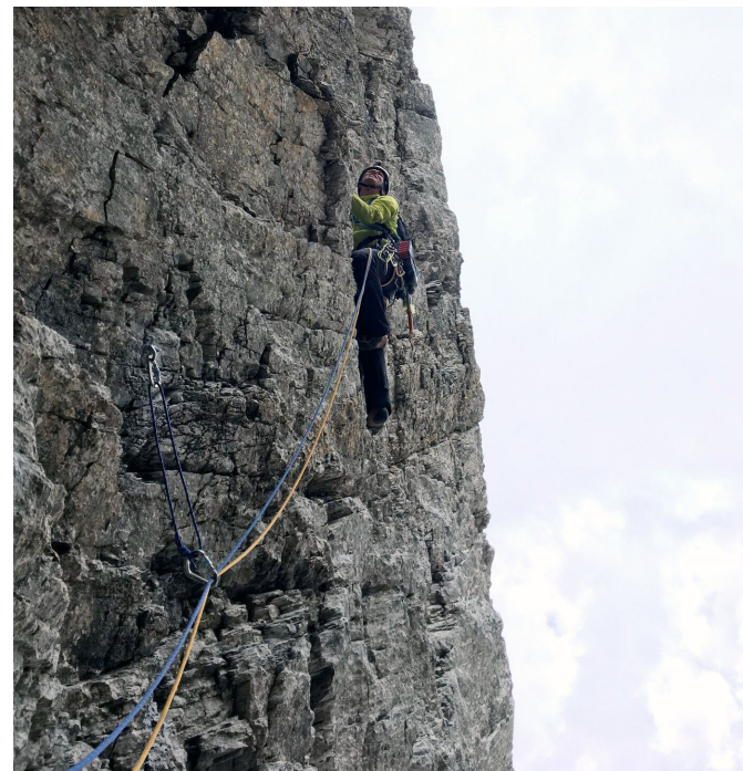
Der luftige Quergang der zweitletzten Seillänge in gutem Fels.