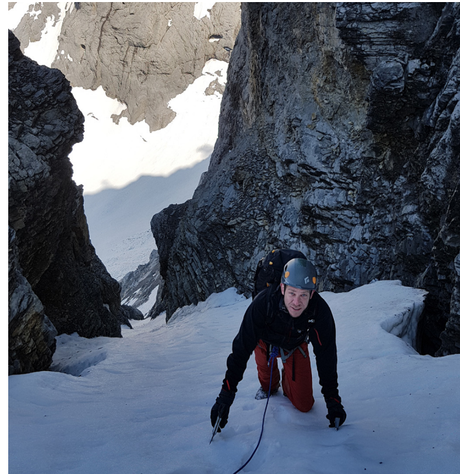
Im 1. Couloir