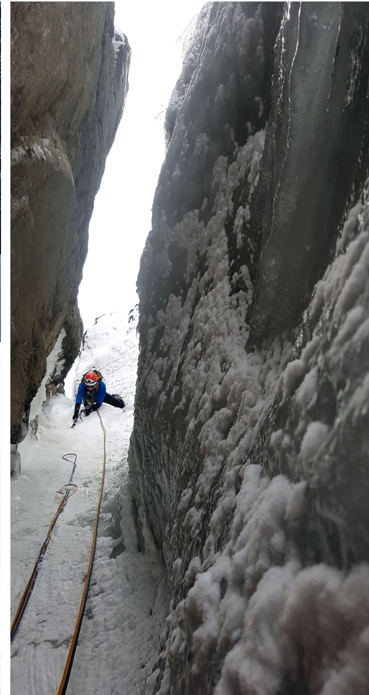
Schönes Eis in der Verschneidung der 1. SL