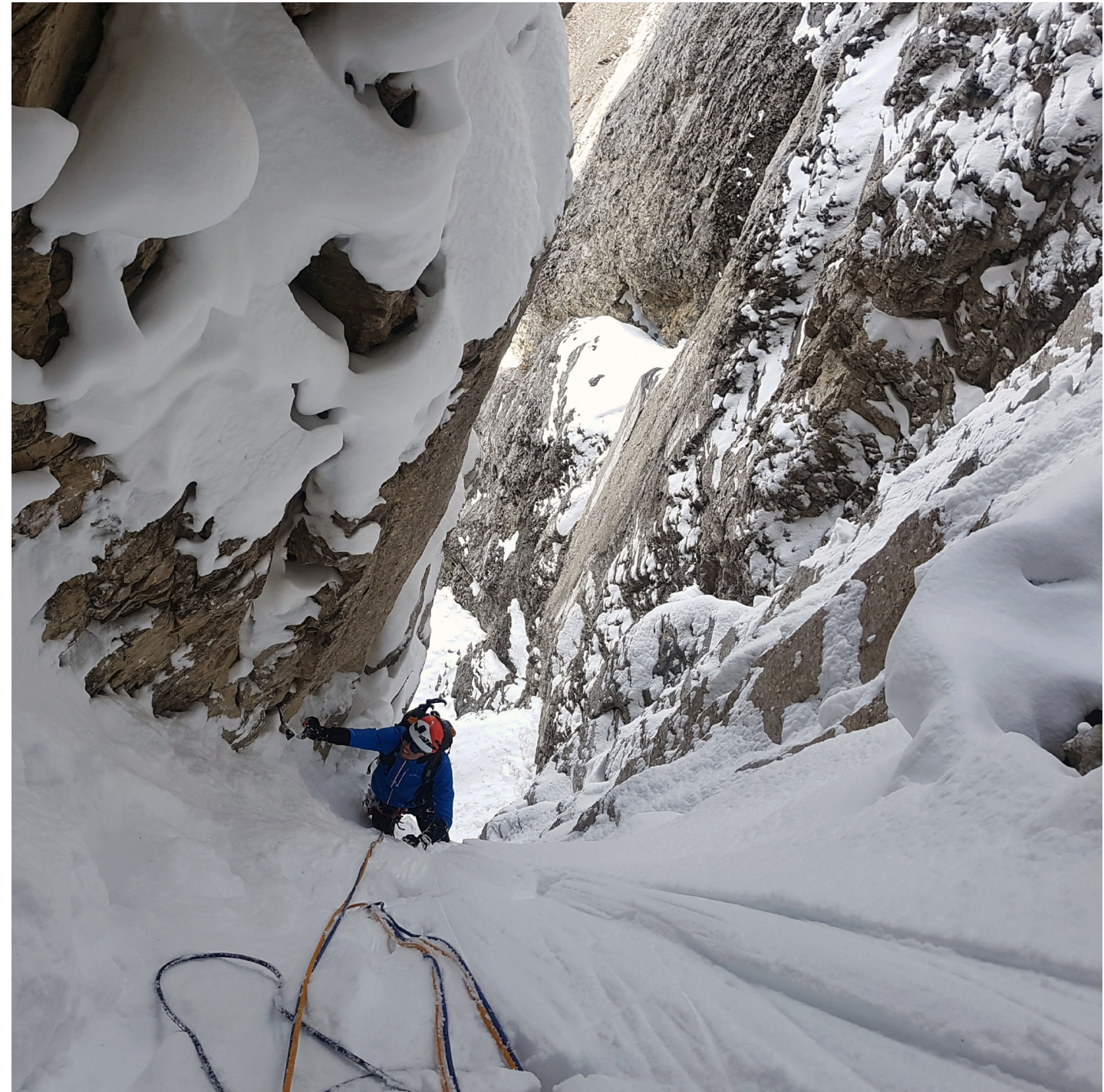
Winterliche Verhältnisse in der grossen Verschneidung „China-Vagina“ kurz vor der unterirdischen Seillänge „Höllenkamin“.